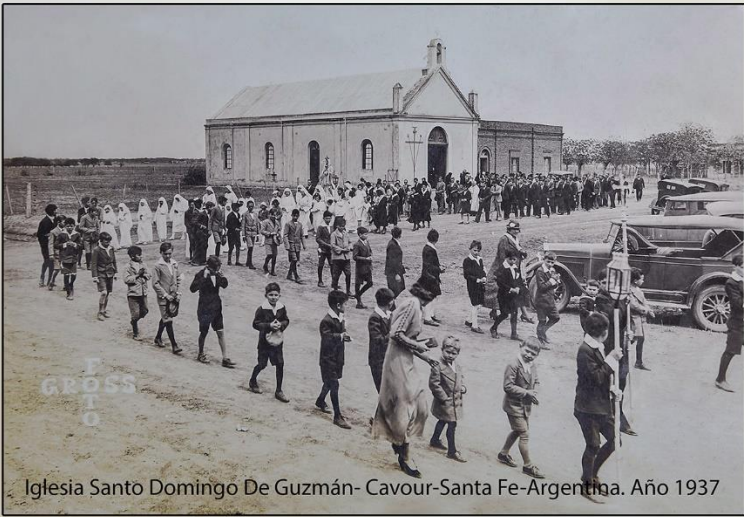
Iglesia Santo Domingo De Guzmán- Cavour-Santa Fe-Argentina. Año 1937