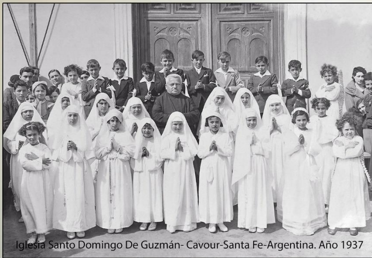
Iglesia Santo Domingo De Guzmán- Cavour-Santa Fe-Argentina. Año 1937

Iglesia de Santo Domingo de Guzmán en Cavour.