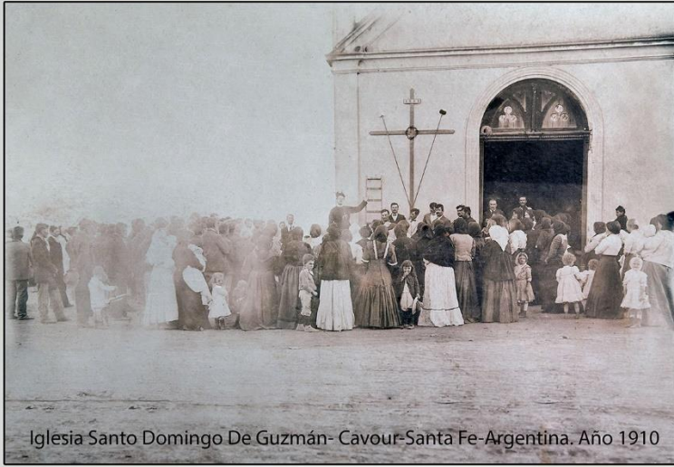
Iglesia Santo Domingo De Guzmán- Cavour-Santa Fe-Argentina. Año 1910