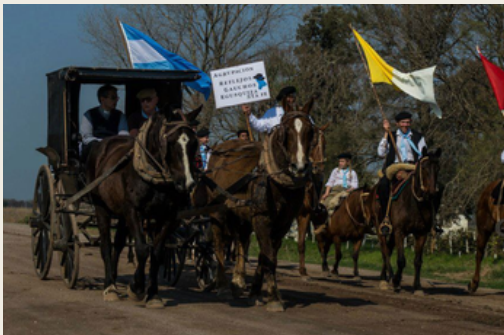
120° aniversario de Capilla Fassi, 29 de agosto de 2012.