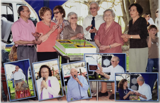
120° aniversario de Capilla Fassi, 29 de agosto de 2012.