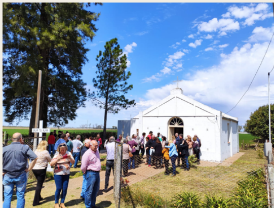
130° aniversario de Capilla Fassi, 29 de agosto de 2022.