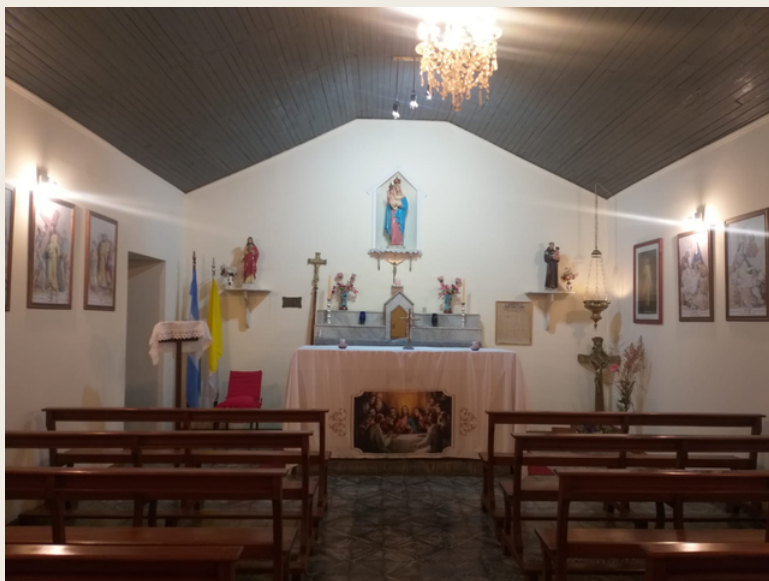
Capilla Fassi en la actualidad.

Pero aquí, en esta feraz y prolífera pampa húmeda y tierra de promisión, habían encontrado aquello que anhelaban y su país natal no le había concedido: PAZ, PAN, TRABAJO, VIDA EN FAMILIAR DEVOCIÓN.