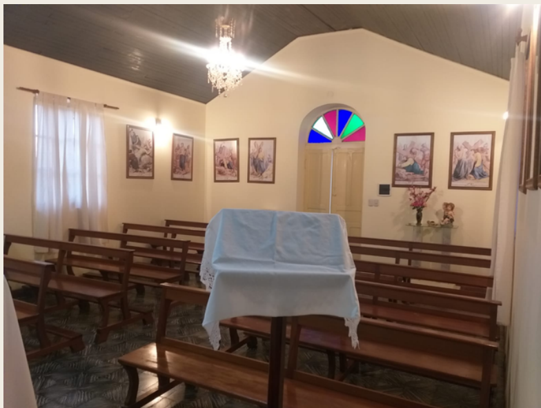
Capilla Fassi en la actualidad.

130 años de permanencia efectiva no es poco tiempo. Algún resquicio sideral salvaguarde su religiosa presencia... ¿Seremos capaces de entender y perpetuar su luminosidad espiritual a través del tiempo y la distancia? Solo los Astros que rielan nuestro inconmensurable Universo frecuentan esos misterios. Nuestra comprensión humana aún no puede develar semejantes destinos cósmicos.