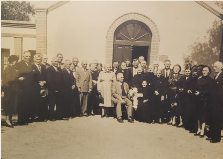
60° aniversario de Capilla Fassi, 29 de agosto de 1952.

Por ese motivo, y con la ayuda y colaboración del incipiente vecindario, devotos habitantes de La zona, levantan la CAPILLA FASSI, inaugurada con solemne misa el día 29 de agosto de 1892.